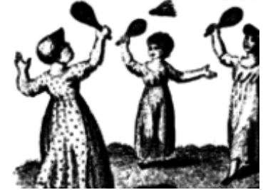
3 Battledore and Shuttlecock

Die zweite Mannschaft des VfB musste sich gegen beide Teams des TV Dillingen jeweils deutlich mit 1:7 bzw. 2:6 geschlagen geben.